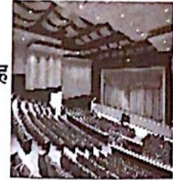
अद्ययावत सभागृह व रंगमंच